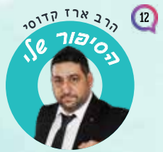
הרב ארז קדוסי הסיפור שלו