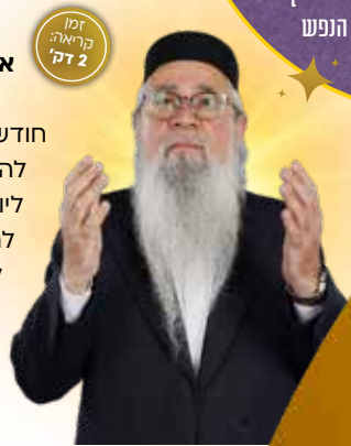
זמן קריאה: 2 דק'

"יום תרועה" כן נקרא ראש השנה בתורה הקדושה, כשהזנב הוא דווקא על מצוות תרועה - תקיעת השופר. רבותינו למדו כי קול השופר הוא קול המלכות המכתייר את הבורא כמלך העולם, ובד בבד הוא מסמל את זעקת התפילה והתחינה הטולה לשמיים. התרועה מבטאת גם את קול הנשמה הפנימי הנאנח על הריחוק שלה ממקור הקדושה, ואת השתוקקותה אליו. לכן ראש השנה נקרא כך בתורה, על שם המצווה המרכזית שבו, שהיא הביסוי המעשי של קבלת מלכות שמיים ושל התעוררות הנפש לתשובה.