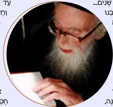
הרב שלמה זלמן אויערבאך זצ"ל

אחד הנהגים ראה זאת וזוהה את הרב. לפיכך הוא עצר את רכבו והזמין את הצדיק: "כבוד הרב, הכנס בבקשה ואקח את הרב לאן שצריך". אמר לו הרב: "לא, לא, אני הולך עם הבחור הזה".