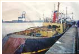
הגוררת בהכנות להפלגה

"בכל דבר הרגשנו את המסירה של הצדיק שליווה אותנו. ראשי הרדיו היו הולכים אל רבי אלעזר פעם בשבוע כדי להתייעץ. ראיתי בעיני את הישרות של האנשים שליוו את הרדיו הזה. לא עשו שום דבר ללא דעת תורה. בדברים שלא רצו להטריד את רבי אלעזר התייעצו עם גדולי ישראל אחרים, אבל כשהיה משהו ברומם של עולם, נסעו לבאר שבע, לבבא אלעזר, לשאול מה לעשות. מי שהיה שם ידע שהוא נמצא במקום טוב ויכול להמשיך לפעול".